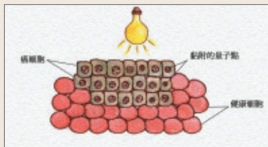
癌症的量子點療法示意圖

「奈米巡警」是奈米機器人(nanorobot)的一種，它們成群結隊在人體內不斷巡邏，專門尋找可疑的病變。這種小機器人具有基本的診斷與治療功能，在發現輕微的疾病後，會在不知不覺間替主人修復。倘若問